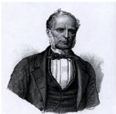
Associazione degli Avvocati di Empoli e della Valdelsa