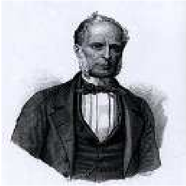
Associazione degli Avvocati di Empoli e della Valdelsa